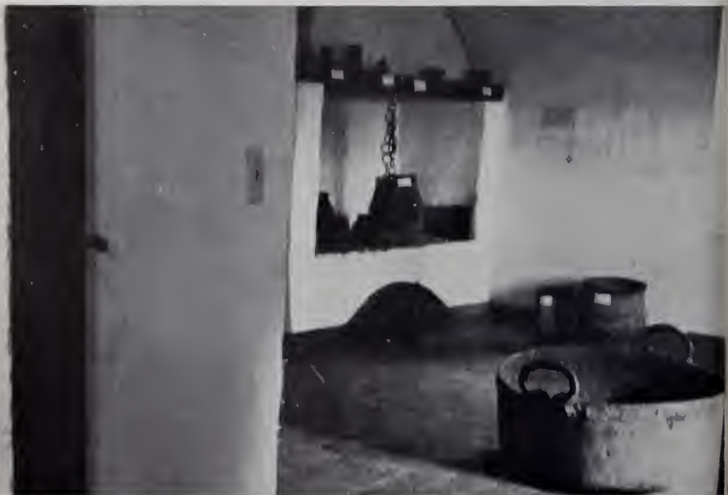
Arriba: Estancia de Sta. Gertrudis de Covadonga, Córdoba.